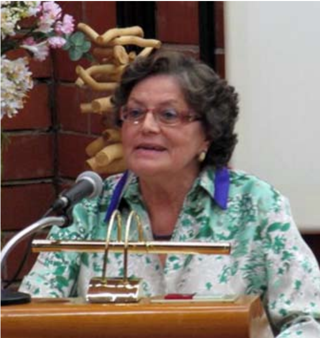
Fig. 7. La Dra. Durfort durant l'acte d'homenatge que la UB va oferir-li el 3 d'octubre del 2013 en agraïment a tota una vida dedicada a la Universitat.