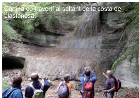
Cortina de travertí al saltant de la costa de Llastanosa.

pont medieval, vam dirigir-nos a la font de la Tosca. El lloc il·lustra la gènesi d'aquesta pedra porosa que conserva formes de restes vegetals pel dipòsit continu de carbonat de calci sobre les superfícies on regalima l'aigua.