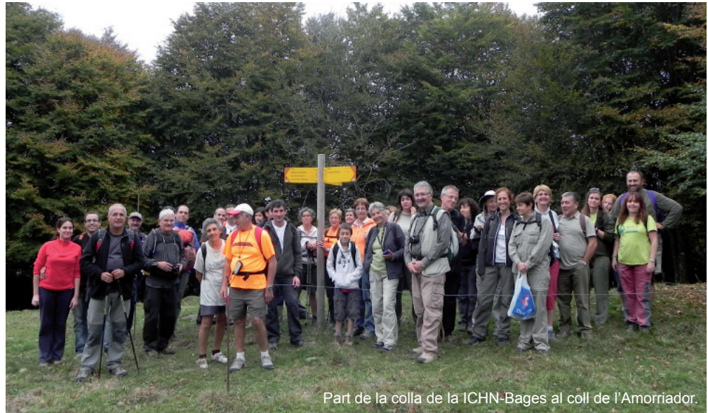
Part de la colla de la ICHN-Bages al coll de l'Amorriador.

A Vidrà, un indret que bé es mereix la visita naturalista detinguda, ens espera ja l'autobús de tornada. La sortida ha deixat molt bones sensacions per la descoberta del torrent de la Masica, natura en estat pur, i per la bellesa de la serra de Milany a la tardor, boscanes euro-siberianes a Catalunya. ■