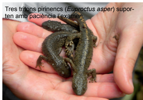
Tres tritons pirinencs ( Euproctus asper ) suporten amb paciència l'examen.

La serra de Milany és part de la serralada Transversal, al bell mig de la Catalunya humida. S'allarga d'est a oest a la partió entre les comarques del Ripollès al nord i d'Osona al sud, i a tocar de la Garrotxa a l'est. Malgrat una altitud d'uns discrets 1.500 metres a la carena, la vegetació de la serra de Milany és plenament euro-siberiana; és un extens enclavament de boscos caducifolis, amb la fageda com a màxim exponent. Vista de fora, la fageda era un mantell estès, il·luminat pels colors de la tardor avançats per la sequera, que cobria les ondulacions i estreps de l'obaga de Milany. Vista de dins, la fageda era un recer de llum càlida matissada per les fulles, en un temple de troncs llisos, drets i vigorosos de faig.