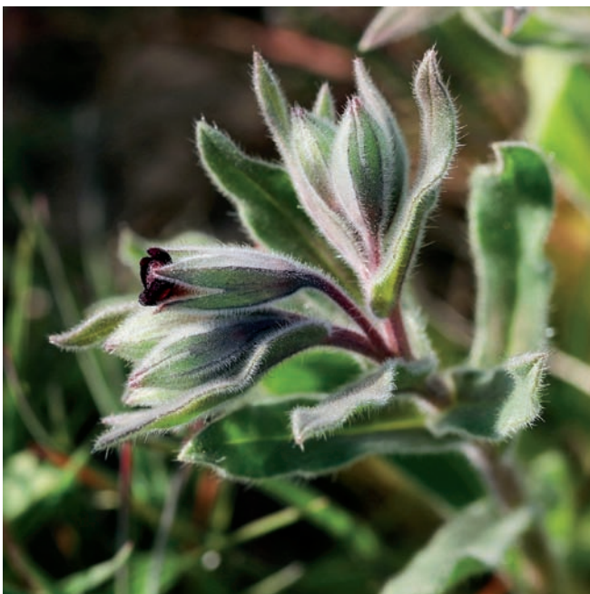
Figura 1. Inflorescència i visió lateral d'una flor de N. vesicaria a Castellserà.

Recentment, dècades després de la citació de Begues i en un context biogeogràfic diferent, hem observat N. vesicaria en un indret de la plana de Ponent. A la localitat de Castellserà, aquesta espècie feia una població localitzada (unes desenes de m 2 ) però força nombrosa, estimada en uns pocs centenars de plantes. L'hàbitat ocupat, herbassars anuals de tendència nitròfila en ambients secs, és l'habitual d'aquesta planta; en aquests herbassars hi havia també una altra espècie del gènere, Nonea micrantha Boiss. & Reut. Tot i que les dades reflectides a les obres florístiques de referència (Bolòs & Vigo, 1996; Valdés & Talavera, 2011) poden fer pensar que aquesta localitat de l'Urgell està molt isolada, no és així, ja