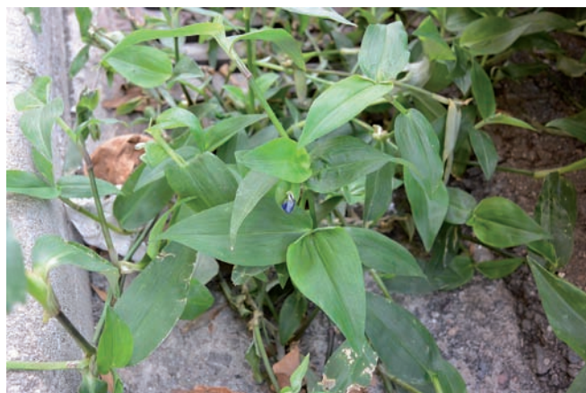
Figura 2. Commelina communis , la Pobla de Segur.