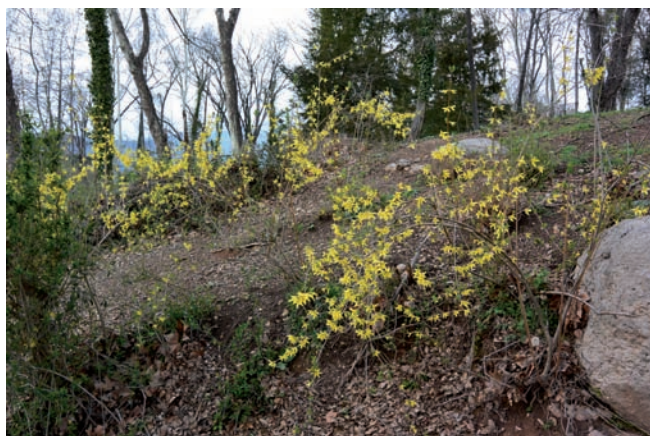
Figura 8. Forsythia suspensa en floració, Avia.

que no escapen del perímetre de zones enjardinades extenses, es fa difícil determinar si els individus de F. suspensa observats són només persistents de cultiu o deriven d'una multiplicació espontània. En aquest cas, considerant la diversitat de mides i la localització, sembla probable que part dels individus observats hagin nascut espontàniament. Aquesta espècie ha estat citada com a allòctona casual en alguns països europeus com Txèquia i Itàlia (Pysek et al. , 2002; Galasso et al. , 2017) i es naturalitza localment a Amèrica del Nord (McClain & Ebinger, 1995). Una espècie actualment molt més cultivada que no pas aquesta, F. intermedia Zabel, ha estat indicada com a persistent de cultiu en hàbitats seminaturals de l'alt Segre (Aymerich, 2016b).