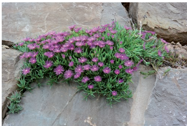
Figura 7. Delosperma cooperi , Berga.

(Cupressaceae, Mediterrània E) Tot i que és freqüent observar exemplars de xiprer escapats de cultiu, les dades referides a naturalització són rares. La presència de l'espècie en aquesta localitat ja es va constatar fa uns anys Aymerich (2013c), però no s'hi havien observat individus reproductors. L'any 2018, en canvi, una tercera part dels xiprers presents havia produït pinyes, tot i ser de mida petita (alçades de 0,5-1,5 m), cosa que suggereix l'establiment d'una petita pobla-