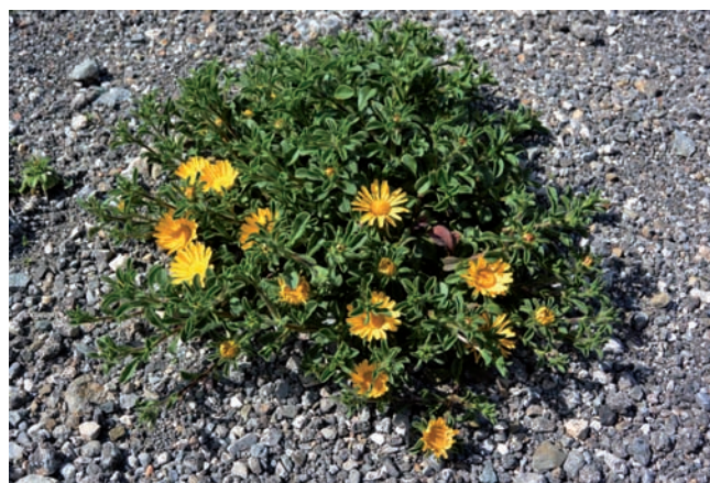
Figura 14. Pallenis maritima , el Port de la Selva.