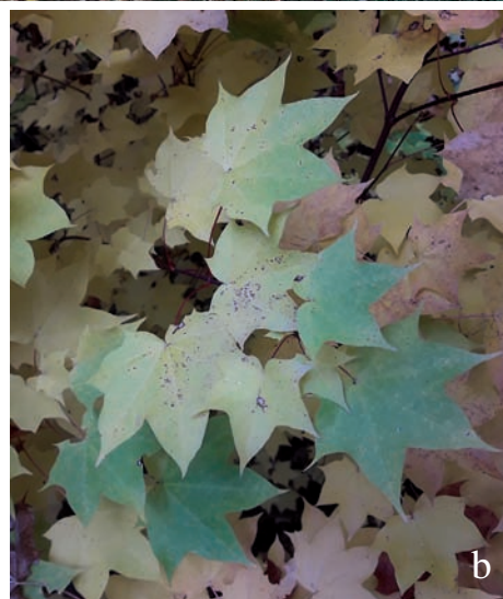
Figura 1. Acer cappadocicum , Ribes de Freser: a) grup dens de rebrotos i joves; b) fulles.

l'antiga zona enjardinada, que en l'actualitat ha estat parcialment ocupada per bardisses. Una part d'aquests individus havia nascut sens dubte de llavor, mentre que altres (aparentment majoritaris) procedien de rebrotos subterranis, una forma de reproducció vegetativa habitual en aquesta espècie.