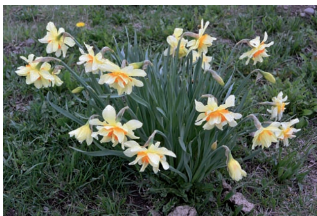
Figura 11. Narcissus × incomparabilis , forma de jardí, Llanars.

RIPOLLÈS: Llanars, entre Llanars i Camprodon, DG4685, 960 m, prat de dall, dos grups clonals, 16-IV-2018; Sant Joan