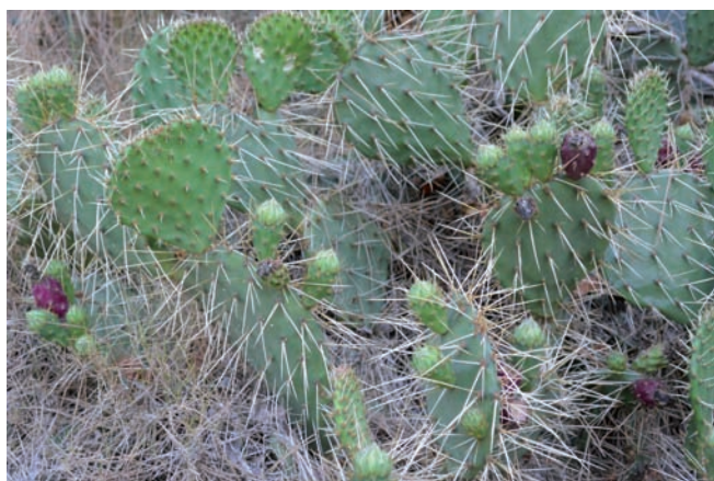
Figura 13. Opuntia tortispina , Santpedor.

(Asteraceae, Mediterrània) En els darrers temps aquesta espècie ha estat força utilitzada en jardineria i ocasionalment es pot escapar. Tot i això, a Catalunya només ha estat assenyalada de tres localitats, al Baix Empordà, a Barcelona i al Baix Ebre (Aymerich, 2017; BDBC, 2018). Aquesta nova localitat de l'Empordà és interessant perquè correspon a una població nombrosa, clarament naturalitzada.