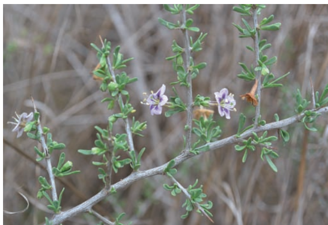
Figura 9. Lycium cinereum , Avià.