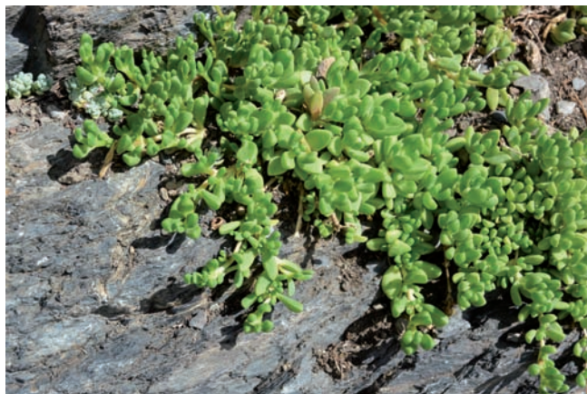
Figura 15. Sedum sarmentosum , Capdella (a l'angle superior esquerre S. dasyphyllum ).

(Asteraceae, Amèrica N) Aquesta herba cultivada com a ornamental està àmpliament naturalitzada a Europa, però a Catalunya només ha estat citada amb aquest caràcter a la ribera del Segre a la Cerdanya (Aymerich, 1998), on és molt rara. Fora d'aquesta àrea, ha estat indicada com a casual en ambients ruderals de l'Alt Urgell (Aymerich, 1998) i de l'en-