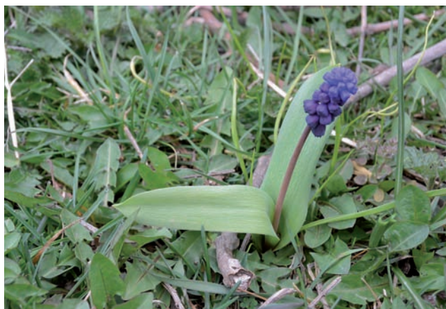
Figura 10. Muscari latifolium , Vilallonga de Ter.

(Aizoaceae, Àfrica S) Aquesta espècie està en procés de naturalització local al litoral del cap de Creus-Albera, al nord de l'Empordà (Pyke, 2008; Giménez, 2011; Aymerich,