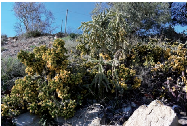
Figura 6. Grup de Cylindropuntia spinosior (plantes baixes) i C. imbricata (planta alta central), Claravalls.

Claravalls, perifèria nord del poble, CG4418, 350 m, talús assolellat entre un camí i unes construccions (amb C. spinosior i Agave americana ), unes poques desenes d'individus, 20-III-2018 (Fig. 6).