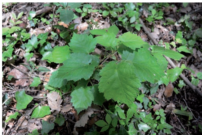
Figura 3. Corylus colurna jove, Avià.

(Betulaceae, Europa SE i Àsia SW) En aquesta localitat coneixiem des de fa més de tres dècades un individu adult solitari d'aquest avellaner arbori, presumiblement plantat a primers del segle XX, quan es va crear una extensa zona enjardinada que ja fa temps que s'està renaturalitzant i en la