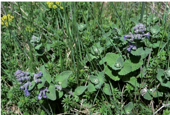
Figura 12. Nepeta racemosa , Das.

ALT PENEDÈS: Sant Martí Sarroca, vessant sota el nucli vell del poble, CF8381-8481, 280-300 m, vessant rocós assolellat en què són freqüents altres plantes suculentes escapades de jardí, unes poques desenes d'individus escampats en una superfície d'1 ha, 26-III-2015; SOLSONÈS: Castellar de la Ribera, castell de Castellar, CG6853, 645 m, talús amb vegetació ruderal, 5 individus, 14-V-2015; Solsona, Cal Xort, CG7851, 700-705 m, talussos i marges de camí al costat d'una casa abandonada (amb Cylindropuntia imbricata , C. spinosior , Opuntia ficus-indica i Agave americana ), 20-30 individus entre els plantats i els espontanis (espontanis almenys 10), 19-XII-2018.