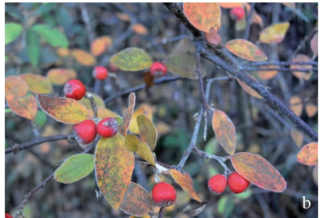
Figura 5. Cotoneaster dielsianus : a) fruits verds a la fi d'estiu, la Molina; b) fruits madurs a la tardor, Sant Joan de les Abadesses.