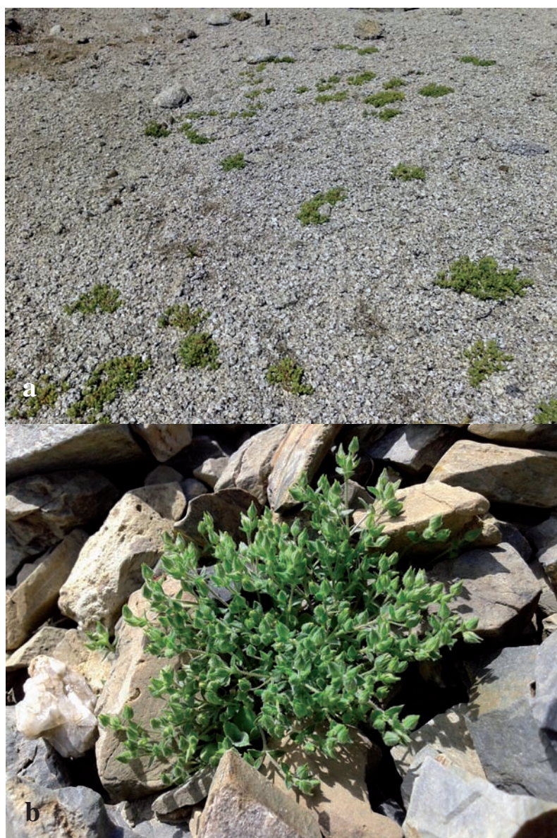
Figura 1. Hàbitat d' Arenaria marschlinii : a) al pui de Linya sobre granit molt descompost; b) detall d'un individu en una tartera esquistosa entre el Bony de les Picardes i el Clot de les Picardes.

31TDG3794, 2440 m, tartera esquistosa, 21-VII-2014, X. Oliver; coll de la Coma de l'Orri, Setcases, 31TDG3795, 2480 m, tartera esquistosa, 21-VII-2014, X. Oliver; puig Pastuira, Setcases, 31TDG4092, 2300 m, clapissars d'esquistos, 25-VII-2014, X. Oliver; entre coll de la Marrana i Bastiments, Setcases, 31TDG3796, 2573 m, tartera esquistosa, 27-VII-2014, X. Oliver; canals de Camamilla, sota portella de Morens, Setcases, 31TDG4097, 2350 m, tartera esquistosa, 27-VII-2014, X. Oliver; serrat de la Coma Clot, Queralbs, 31TDG3294, 2525-2675 m, clapissar d'esquistos 11 i 17-VIII-2014, M. Alabau; Fontnegre, Queralbs, 31TDG3294, 2530-2670 m, clapissar d'esquistos al voltant del camí, 27-VIII-2014, M. Alabau; coma de la Llebrada, Queralbs, 31TDG2996, 2495-2730 m, tartera esquistosa, 28-VIII-2014, M. Alabau; coll d'Eina, Queralbs, 31TDG3294, 2580-2.640 m, tartera esquistosa 22-VIII-2014, M. Alabau; sota la carena del Puig de