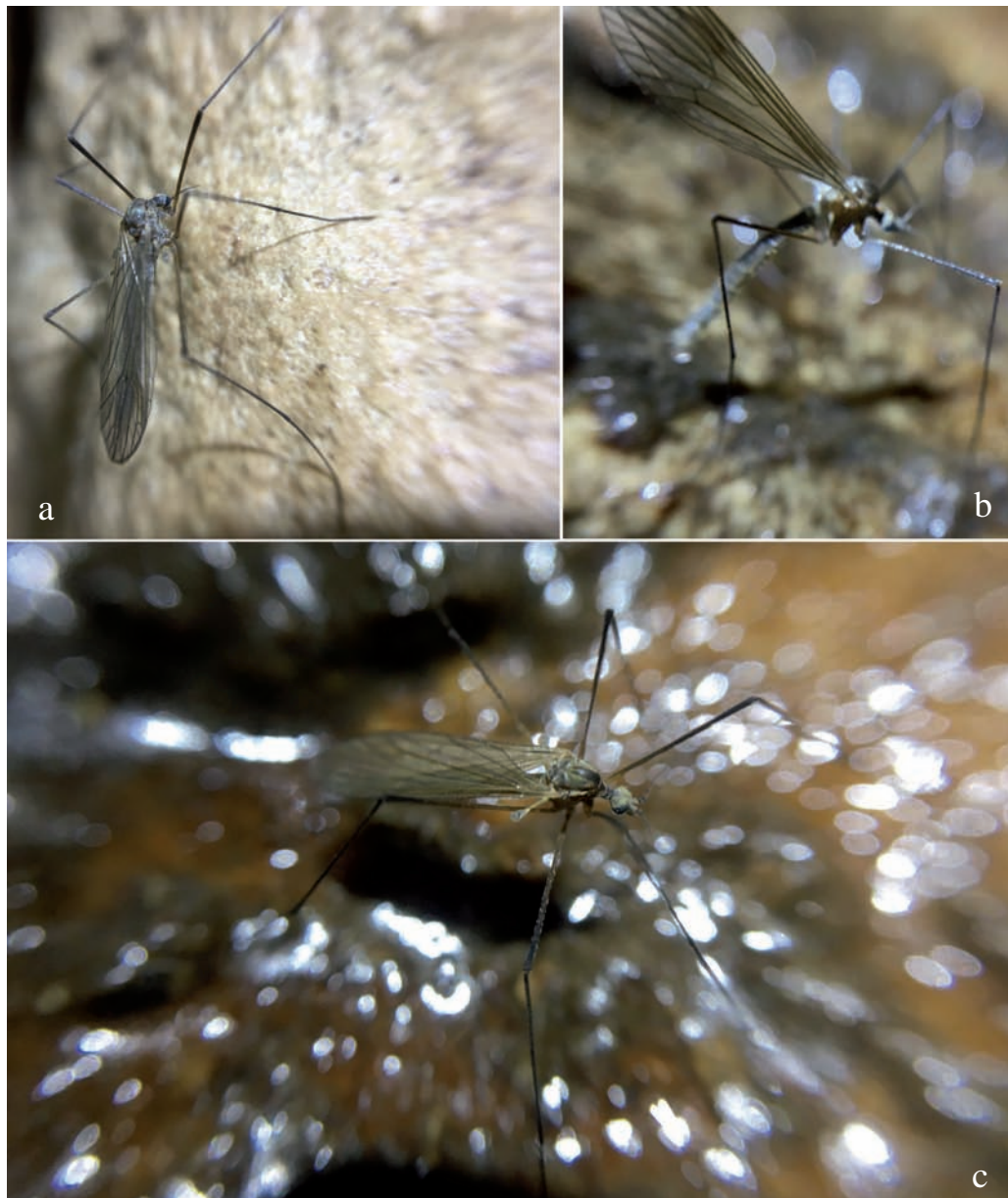
Figura 3. a) Espécimen hembra de Tricyphona (Tricyphona) contraria en Avenc Pouetons de les Agulles, en visión dorsolateral y posición de reposo sobre la pared de la cueva. Espécimen macho en la misma localidad: b) mostrando la postura al caminar; c) en posición de reposo sobre el suelo cubierto de guano de murciélago.

Con estas citas se confirma su presencia en España y amplía su distribución a Asturias y Huesca.