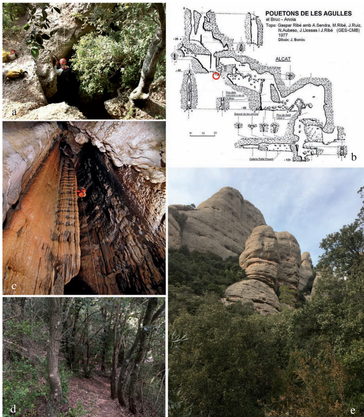
Figura 1. a) Imagen de la entrada; b) topografía de la cavidad Avenc dels Pouetons de les Agulles, Montserrat; c) descenso del pozo hasta la cota -50m de profundidad donde se encontró la especie Tricyphona (Tricyphona) contraria ; d-e) aspecto general del sitio de ubicación de la cavidad y de la vegetación aledaña a la misma. Imagen de Francesc Rubinat (a) y Víctor Ferrer Rico (c).