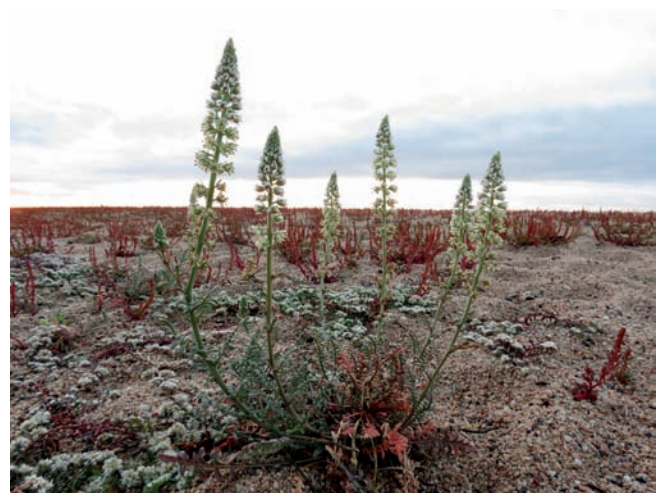
Figura 1. Exempler de Reseda hookeri a la platja de Santa Susanna.