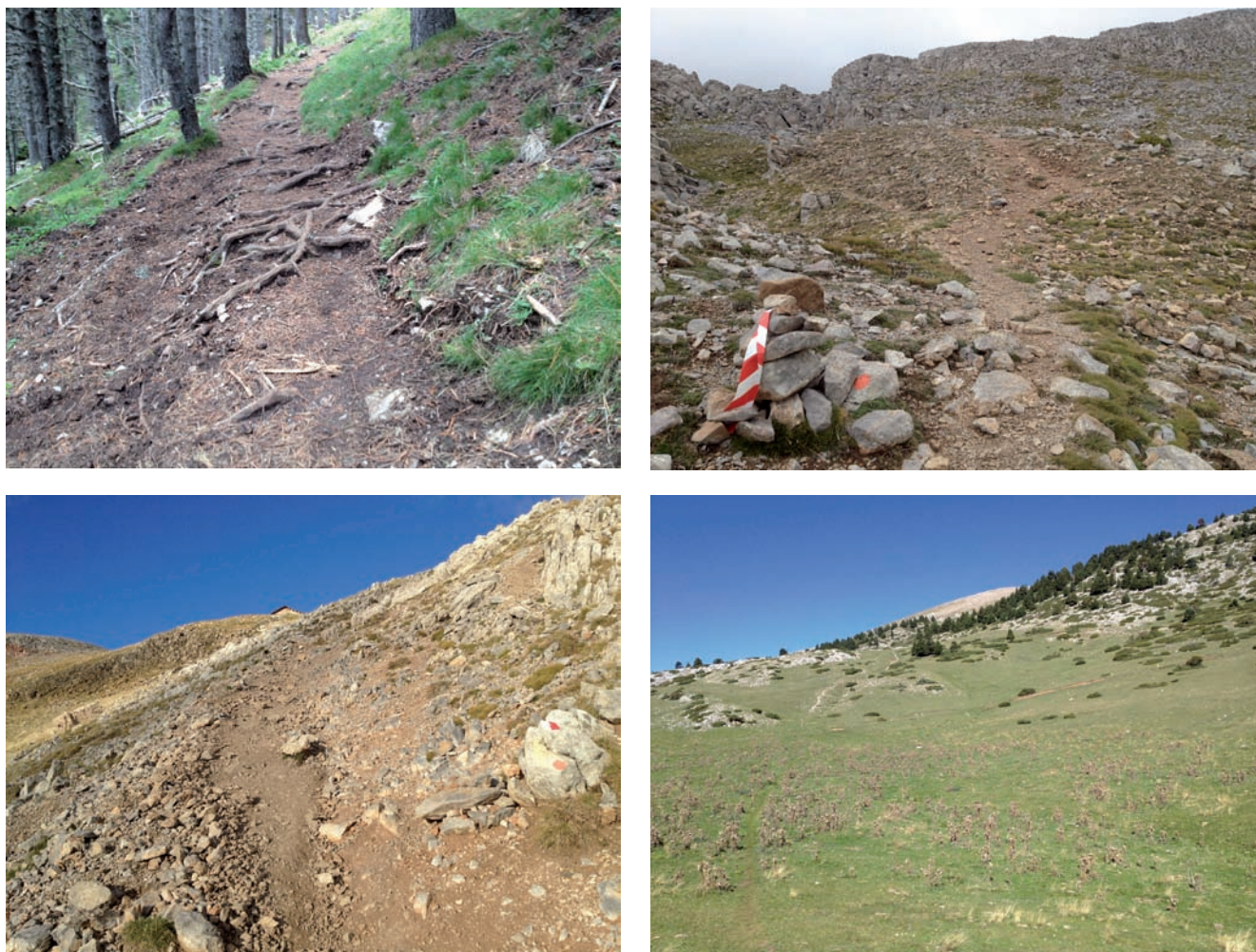
Figura 2. Diferents estacions de mostreig associades a geotops de la traça de l'Ultra Pirineus del Parc Natural del Cadí Moixeró.

Les dades resultants de les 12 estacions de control (Fig. 1, Taula 1) de la cursa varien en funció de la traça i del geotop analitzat. Com a denominador comú observem una major compactació de sòls en totes les estacions analitzades, independentment de la cobertura vegetal i dels seus pendents, comportant una pèrdua puntual de la qualitat del sòl, i en conseqüència una afectació directa a la vegetació, així com a una disminució puntual de la capacitat d'infiltració. A les zones amb vegetació arbustiva i/o arbòria, amb acumulació de fullaraca i matèria orgànica, aquesta compactació és recuperable i l'efecte és considera admissible. Segons els geotops analitzats obtenim: