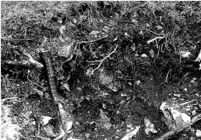
FIGURA 4. Perfil de sòl AI-20/3 (Cryrendoll lític, esqueleticoargilós, mesclat, actiu).

Classificació: Cryrendoll lític, esqueleticoargilós, mesclat, actiu.