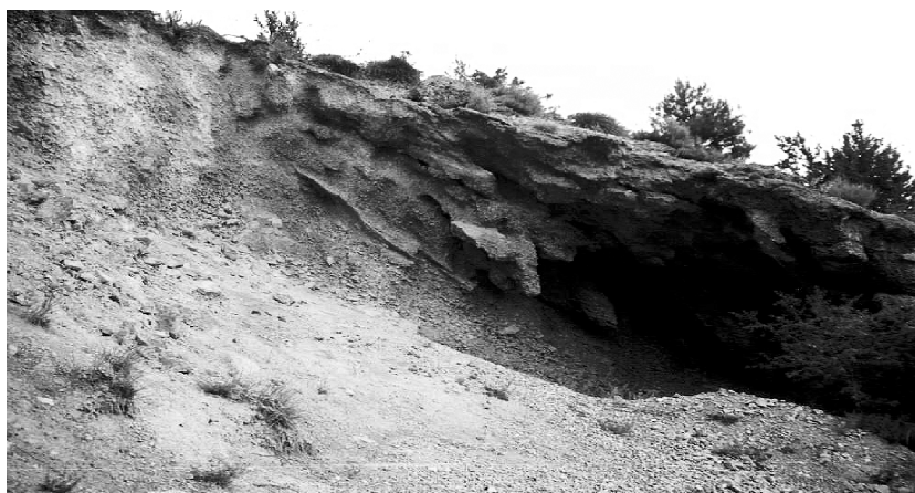
FIGURA 13. Talús de la carretera L-401 d'Alinyà a Llinars mostrant l'horitzó petrocàlcic amb digitacions.

Exemples fàcilment visibles d'aquests horitzons petrocàlcics es troben a la carretera d'Alinyà a Llinars (L-401), a l'alçada del roc dels Castellons (figura 13), que mostren també digitacions resultants del flux d'aigua subsuperficial característic d'aquests vessants. I un altre exemple es troba al sollell de l'Alzina d'Alinyà, on aflora en molts trams del vessant per l'erosió dels horitzons de sòl més superficials (figura 14).