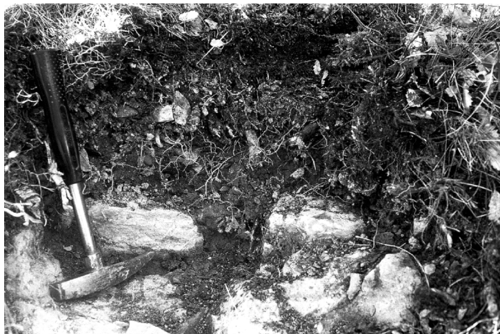
FIGURA 11. Perfil de sòl AI-9/2 (Ustorthent lític, argilós, mesclat, calcari, actiu, mèsic).

Classificació: Ustorthent lític, argilós, mesclat, calcari, actiu, mèsic.