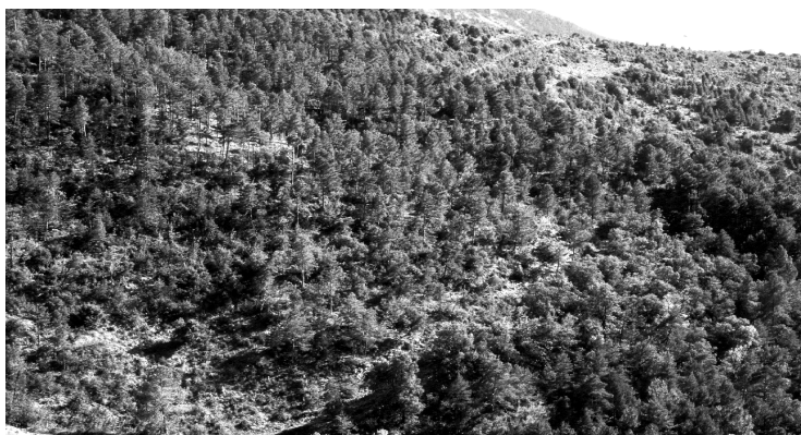
FIGURA 9. Paisatge de sòls dels vessants de la part més baixa de la vall.

La vegetació ja es correspon amb un clima més temperat i sec, amb àmplies zones cobertes per matolls, un cert predomini de Pinus nigra (figura 9) i la presència freqüent d'oliveres a les terrasses abandonades.