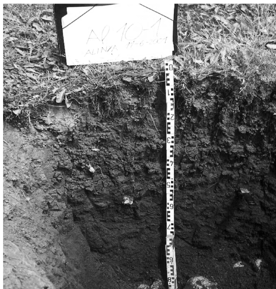
FIGURA 5. Perfil de sòl AI-10/1 (Eutrochryept oxiàquic, fi, mesclat, actiu).