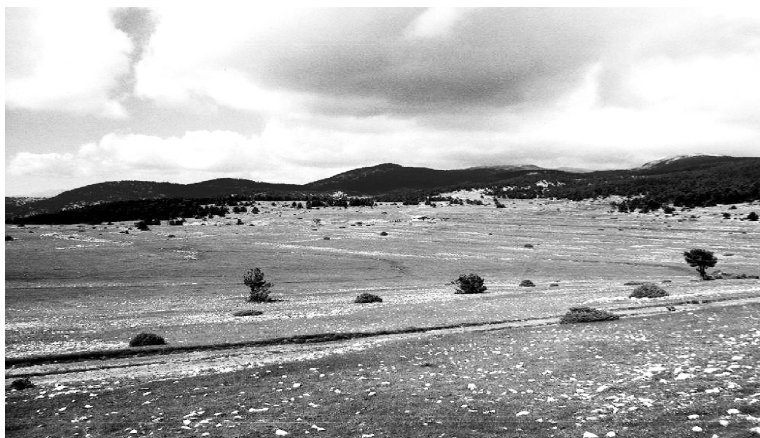
FIGURA 1. Paisatge de sòls de les plataformes calcàries altes. En primer terme, relleu suau. A mitja fotografia, fons en còm. A la dreta, cobert pel bosc dens, vessant de fort pendent.

Els relleus suaus, amb pendent inferior al 30 %, en general, són utilitzats com a prats o bé han desenvolupat un bosc esclarissat de Pinus uncinata o P. sylvestris en