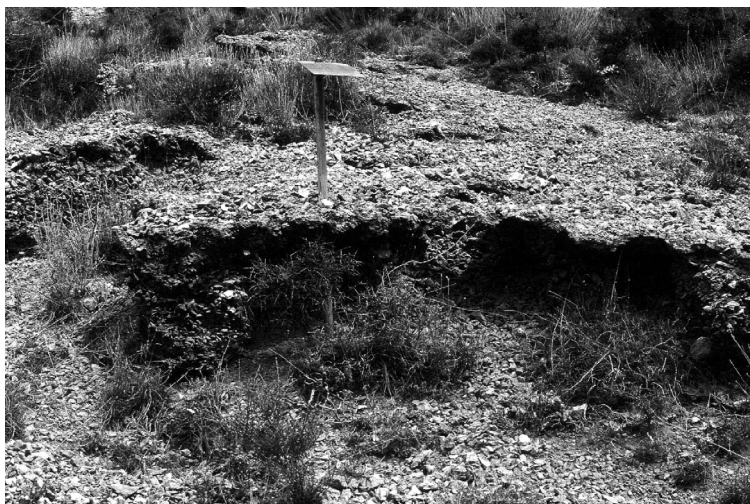
FIGURA 14. Horitzó petrocàlcic aflorant a la superfície del vessant com a resultat de l'erosió dels horitzons superficials del sòl (l'Alzina d'Alinyà).

La presència d'aquest horitzó petrocàlcic no queda ben reconeguda a Soil Taxonomy. D'una banda, sembla que aquesta no considera possible la presència d'aquests horitzons a Inceptisòls de climes amb règim d'humitat údic, però sí amb règim xèric o ústic, ja que no es considera com a caràcter diagnòstic per als subgrups del subordre Udepts, però sí als dels subordres Xerepts i Ustepts. I de l'altra, als Mollisòls no es fa aquesta distinció, i es reconeix l'horitzó petrocàlcic com a diagnòstic tant per als Udolls com per als Xerolls i Ustolls, si bé no per als Rendolls, la definició dels quals hauria d'incloure, per tant, la presència d'horitzó petrocàlcic, i no només d'argilós o càlcic, com a criteri exclouent.