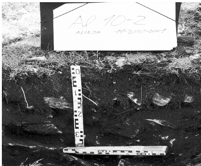
FIGURA 2. Perfil de sòl Al-10/2 (Cryrendoll lític, esqueleticoargilós, mesclat, actiu).