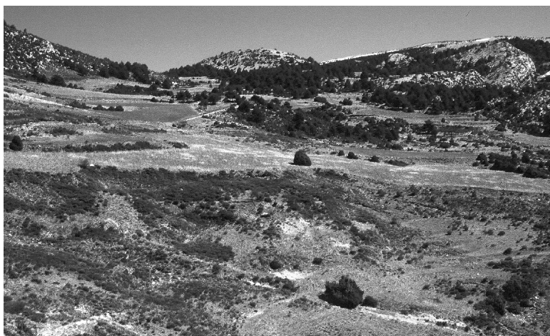
FIGURA 15. Cicatrius deixades per moviments en massa a la capçalera del riu de la Peça.

No són gaire freqüents els trets indicadors de moviments en massa, si bé localment, per exemple a la capçalera del riu de la Peça (figura 15) i al torrent de Gol, hi ha evidències clares, però no intenses, d'aquest tipus de dinàmica dels vessants.