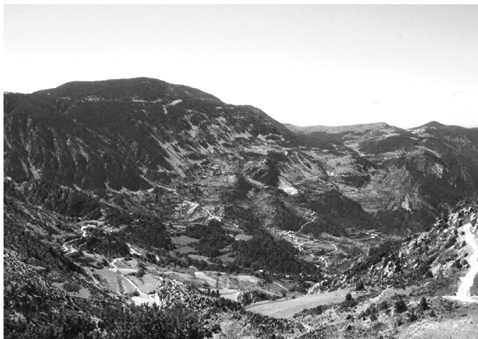
FIGURA 6. Paisatge de sòls dels vessants dominats per les plataformes calcàries, situades a l'esquerra de la fotografia.

Dins d'aquest paisatge de sòls s'han definit dues unitats: els vessants de fort pendent i els replans sobre calcàries (figura 6).