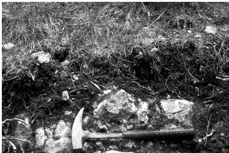
FIGURA 10. Perfil de sòl AI-7/1 (Udorthent lític, argilós, mesclat, calcari, actiu, frígid).

Classificació: Udorthent lític, argilós, mesclat, calcari, actiu, frígid.