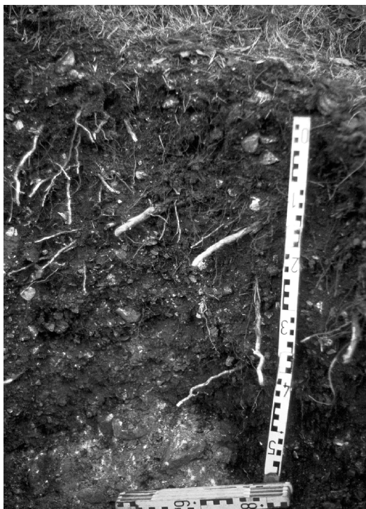
FIGURA 8. Perfil de sòl AI-6/2 (Eutrudept rendòlic, esqueleticofranc, mesclat, actiu, frígid).