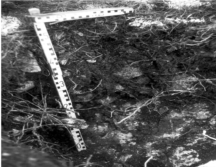
FIGURA 3. Perfil de sòl AI-8/2 (Udorthent lític, esqueleticoargilós, mesclat, calcari, actiu, frígid).

Els sòls d'aquesta unitat es desenvolupen sobre dos tipus de materials diferents. D'una banda, i normalment als vessants amb menys pendent d'aquesta unitat (30-45 %), els sòls s'han desenvolupat sobre la roca calcària. I de l'altra, als pendents més forts (més grans de 45 %), els materials originals dels sòls són col·luvions amb un percentatge alt d'elements grossos de calcària.