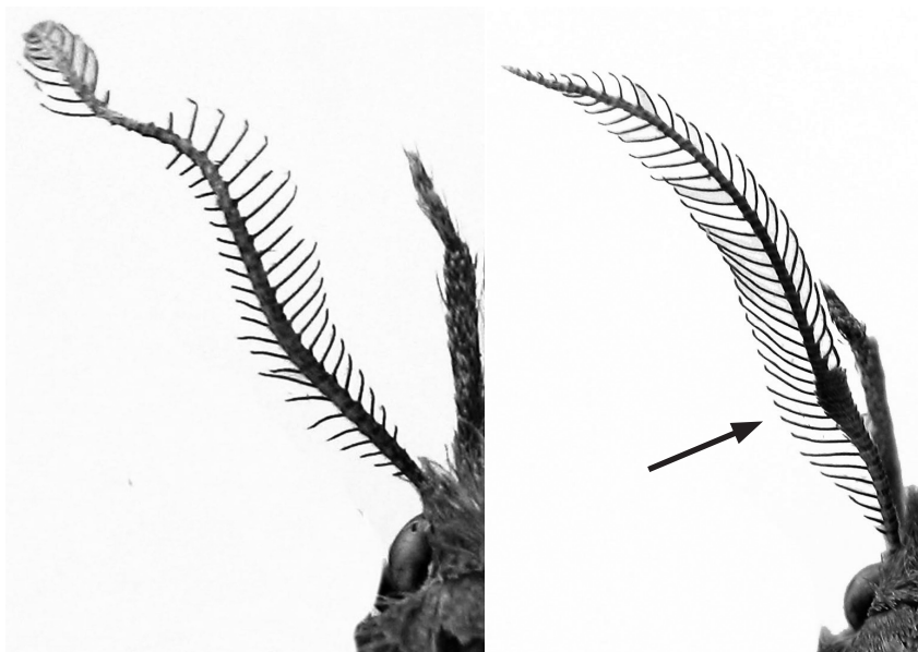
Fig. 2 Detall de les antenes de Pechipogo simplicicornis (Zerny, 1935) (a) i P. plumigeralis Hübner, [1825] (b).